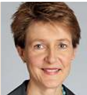
Simonetta Sommaruga, consigliera federale, capo del Dipartimento federale di giustizia e polizia