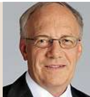
Johann N. Schneider-Ammann, consigliere federale, capo del Dipartimento federale dell'economia