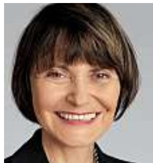
Micheline Calmy-Rey, consigliera federale, capo del Dipartimento federale degli affari esteri

In nome dei tre Dipartimenti responsabili della libera circolazione delle persone: