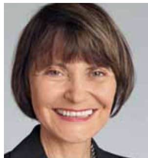
Micheline Calmy-Rey, consigliera federale, capo del Dipartimento federale degli affari esteri

In nome dei tre Dipartimenti responsabili della libera circolazione delle persone: