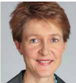
Simonetta Sommaruga, consigliera federale, capo del Dipartimento federale di giustizia e polizia