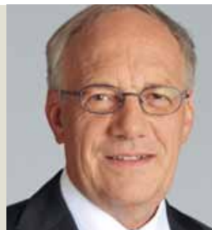
Johann N. Schneider-Ammann, consigliere federale, capo del Dipartimento federale dell'economia